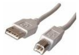
Le port USB

Le port usb peut aussi accueillir une interface Usb/Série qui permet d'ajouter un port série sur votre ordinateur et de bénéficier de tous les avantages de cette interface. ( voir plus haut )