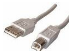
Le port USB

Le port usb peut aussi accueillir une interface Usb/Série qui permet d'ajouter un port série sur votre ordinateur et de bénéficier de tous les avantages de cette interface. ( voir plus haut )