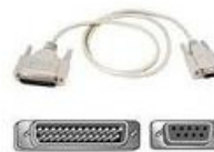
Adaptateur USB- SERIE